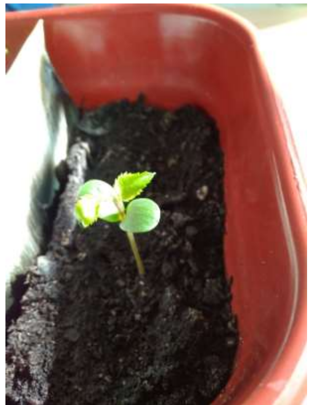
Фото 8. Яблоня.