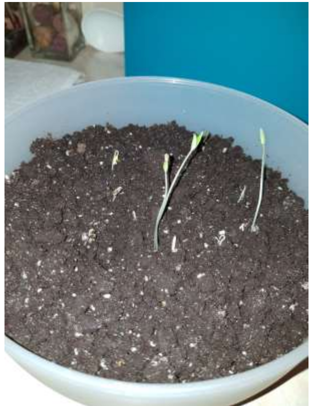
Фото 6. Помидор.