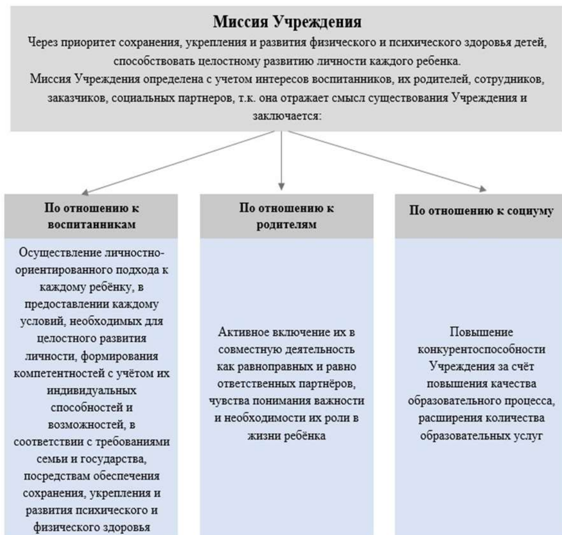
Рисунок 1- Миссия МАДОУ "Детский сад № 270"

МАДОУ расположено внутри жилого микрорайона. Население микрорайона представлено служащими, рабочими, интеллигенцией, пенсионерами.